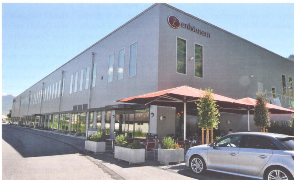
Das neue «Centre Zen» umfasst einen Laden mit Restaurant und Terrasse.

Angesichts der Lage am Hang schlug die mit der Planung beauftragte Firma IE Food Engineering vor, einen zweistöckigen Bau zu erstellen, mit der Administration, Personalbereich und dem Laden mit Restaurant im Untergeschoss und der Produktion und Logistik auf der grösseren Fläche im Obergeschoss. An- und Auslieferung mit sieben Andockstellen für Lastwagen befinden sich hinter dem Gebäude am Hang und ebenerdig beim Obergeschoss.